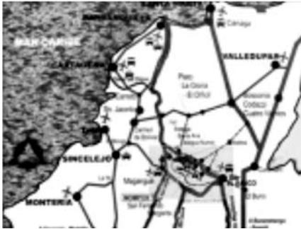
Mapa No 4: La Isla de Mompóx en el ZODES Depresión Momposina.

b.- El ZODES DEPRESIÓN MOMPOSINA Bolivarenses que comprende los 6 municipios localizados en la Isla de Mompóx;