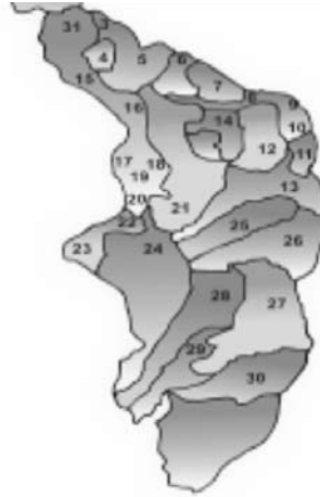
Mapa No 1: Región del Sur de Bolívar, Colombia.

en las localidades del Sur de Bolívar desde el conflicto armado. Estos elementos explicativos básicos son estrictamente variables y por lo tanto son históricos y están en continuo cambio.