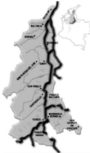
Mapa No 5 La Localidad de Morales en el ZODES Magdalena Medio.

c.- El ZODES LOBA integrada por 6 municipios localizados sobre las márgenes del Brazo de Loba y