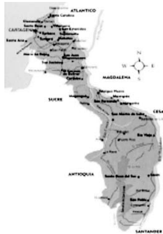
Mapa No 2 El Departamento de Bolívar con la Serranía de San Lucas.

Su territorio cuenta con una variada geografía en la que se incluyen zonas llanas y ligeramente onduladas en la costa, montañas hacia el interior como la de María (con alturas de 800 m, como el cerro Maco), ciénagas y zonas inundables en la conocida depresión Momposina y selvas en el sur, en la serranía de San Lucas, cerca de las estribaciones de la cordillera Central.