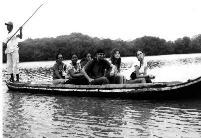
Foto No. 1 Integrantes del Semillero de Sociología Jurídica con su directora en la Ciénaga de la Virgen.

En la siguiente salida de campo nos encargamos de comprobar de manera directa la contaminación de la cual es víctima la Bahía de Cartagena, fuimos testigos del daño que ocasionan las empresas que se encuentran a todo lo largo de este importante cuerpo de agua, realmente falta mucho por hacer en lo que ha esto se refiere, por tal razón hemos tomado la decisión de presentar Acciones Populares que busquen la protección de este frágil ecosistema.